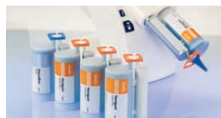
Cartouches MixStar Honigum et StatusBlue pour un mélange dynamique dans la machine MixStar-eMotion