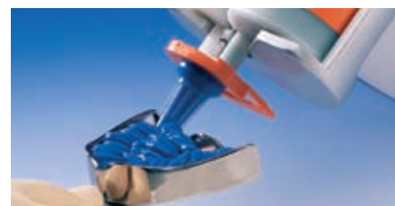
Remplissage rapide du porte-empreinte aux niveaux de vitesses 2 et 3 Port