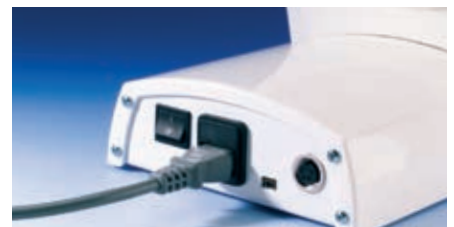
Connexion de la pédale pour la commande optionnelle au pied et le port USB pour la mise à jour du programme