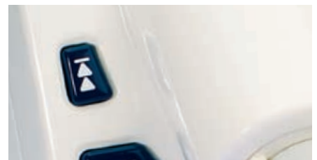
Commande pour le changement rapide de cartouche