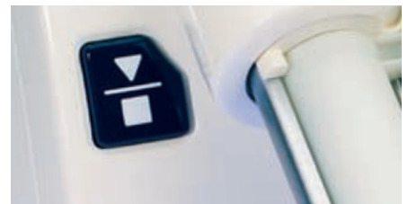
Interrupteur marche-arrêt pour le mélange automatique