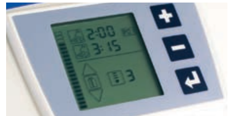
Ecran avec deux minuteries et trois niveaux de vitesse

La MixStar-eMotion procure une qualité de matériau toujours homogène et sans bulles grâce à sa régulation électronique. Le matériau arrive dans le porte-empreinte ou la seringue avec toujours le dosage optimal et vous pouvez être certain que vous travaillerez de façon économique car le gaspillage de produit sera réduit au maximum. En programmant exactement les temps de travail et de prise pour le mélange de chaque produit en particulier, les erreurs d'enregistrement pourront être évitées. Les cartouches MixStar DMG indiquent les temps respectifs pour prévenir tout risque d'erreur de procédure.